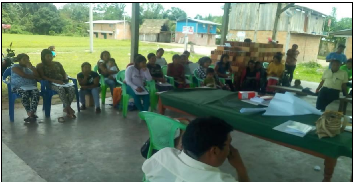
Participantes previos al inicio del taller