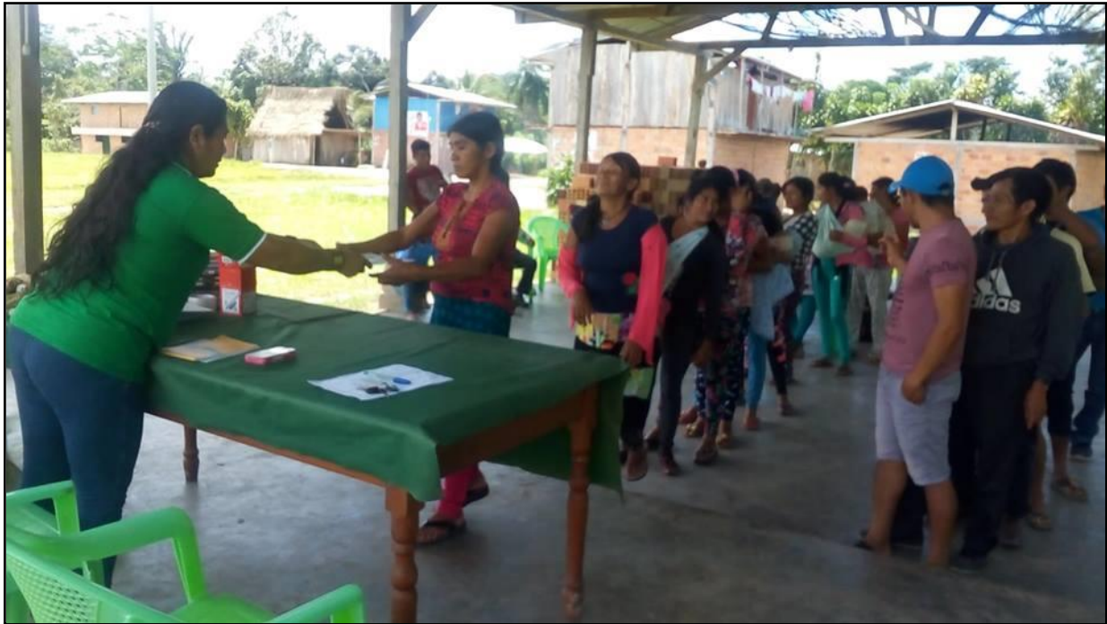
Entregando materiales a las y los participantes del taller