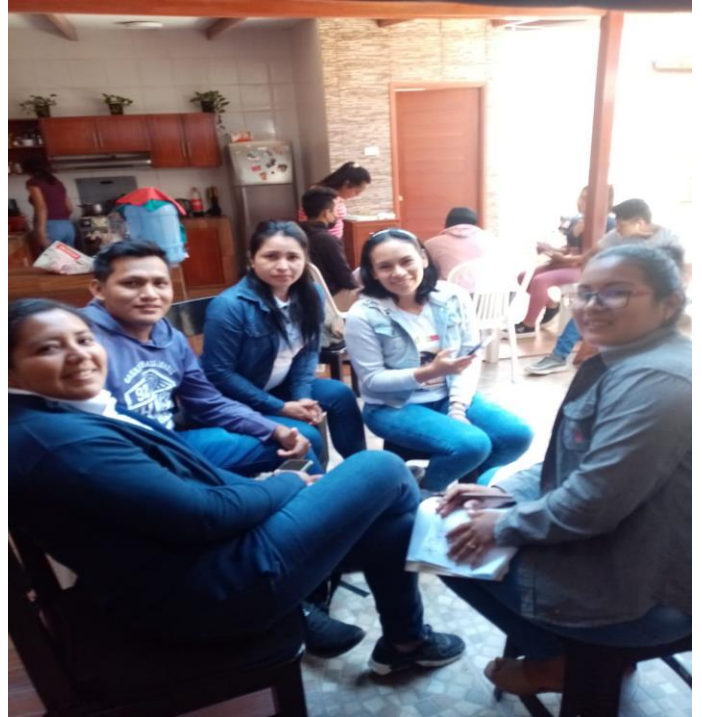
EQUIPO MULTIDISCIPLINARIO HOSPITAL TARAPOTO